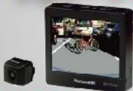
リアビュー モニター