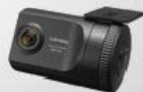
ドライブレコーダー