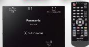
地デジチューナー